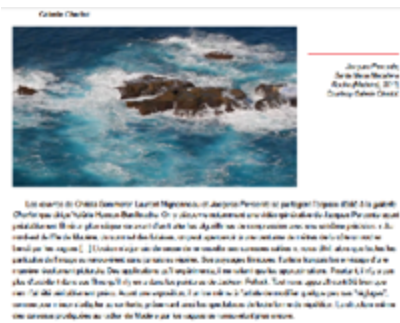
mediaartdesign.net UNPAINTED Munich Dominique Moulon 31/01/2014