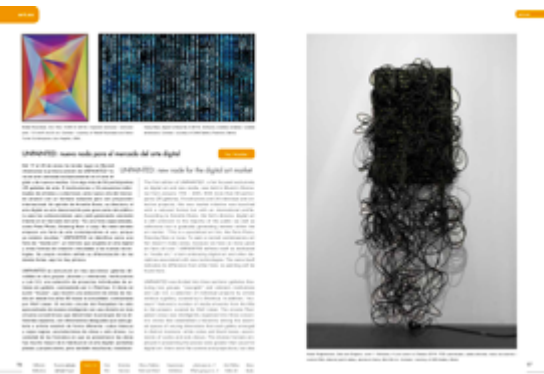
Arte-es UNPAINTED: new node for the digital art market Pau Waelder Laso 14/03/2014 Lire