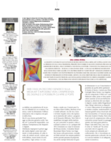
Business people Rivoluzione digitale Domenico Quaranta 15/03/2014 Lire