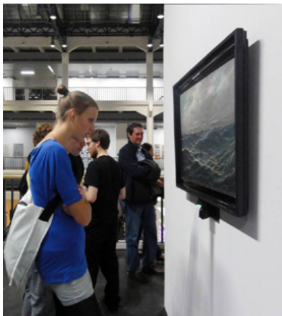
Installation interactive, peinture, programme spécifique, imprimante thermique Interactive installation, painting, specific program, thermal printer