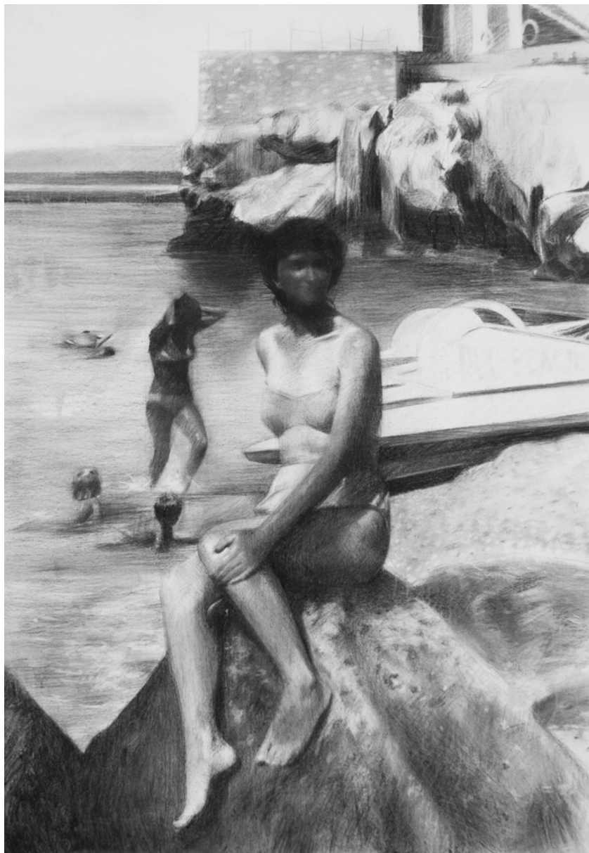
Plage de rochers I, 2011 - fusain sur toile – 116 x 81 cm

2008 - 2011 Artiste résidente à "Espai TPK". Centre Cultural Tecla Sala. Barcelone, Espagne 2010 Résidence de Création : BCN-TNS 2010. Tunis, Tunisie