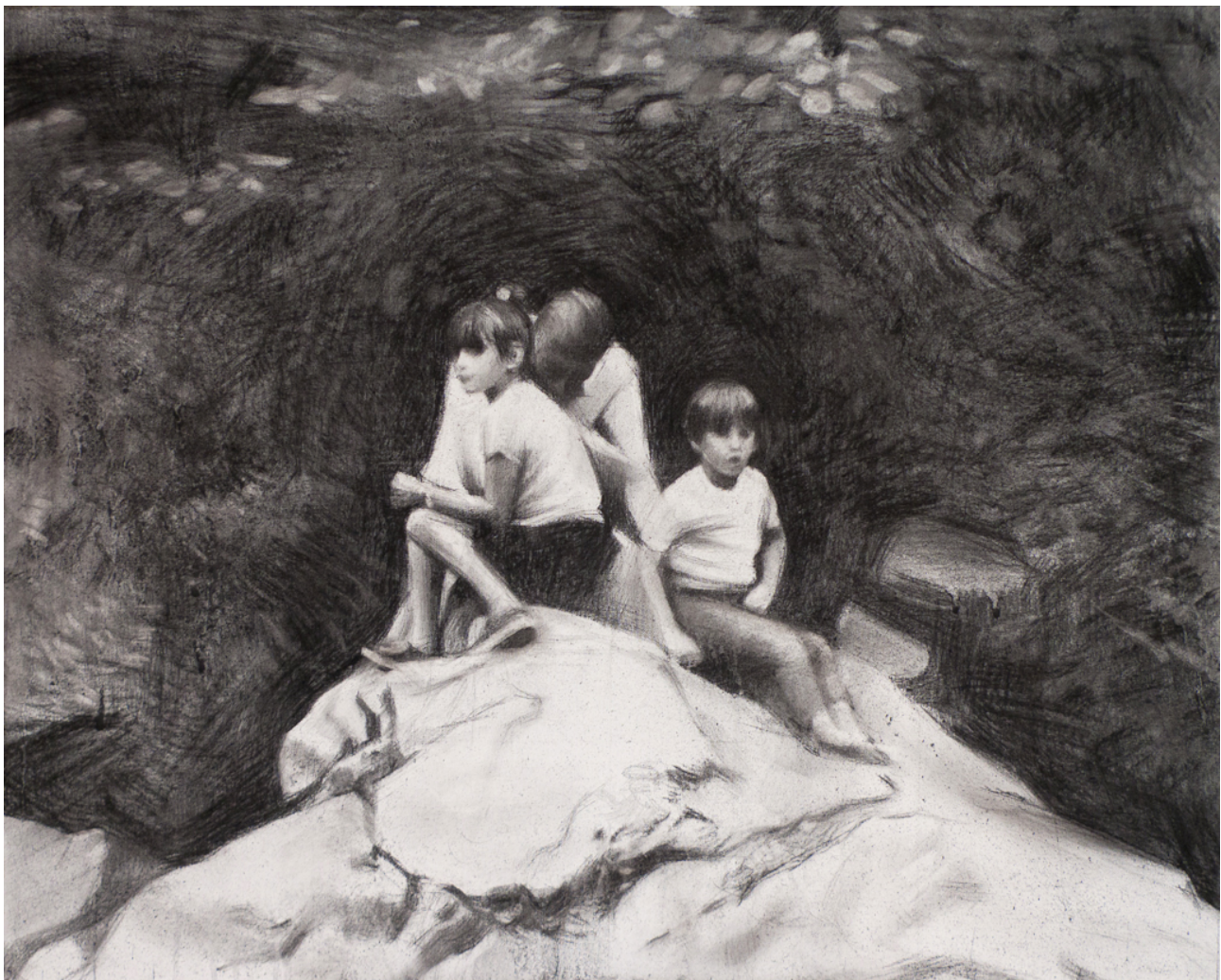
Reunidos 2011 - Fusain et acrylique sur toile – 65 x 81 cm