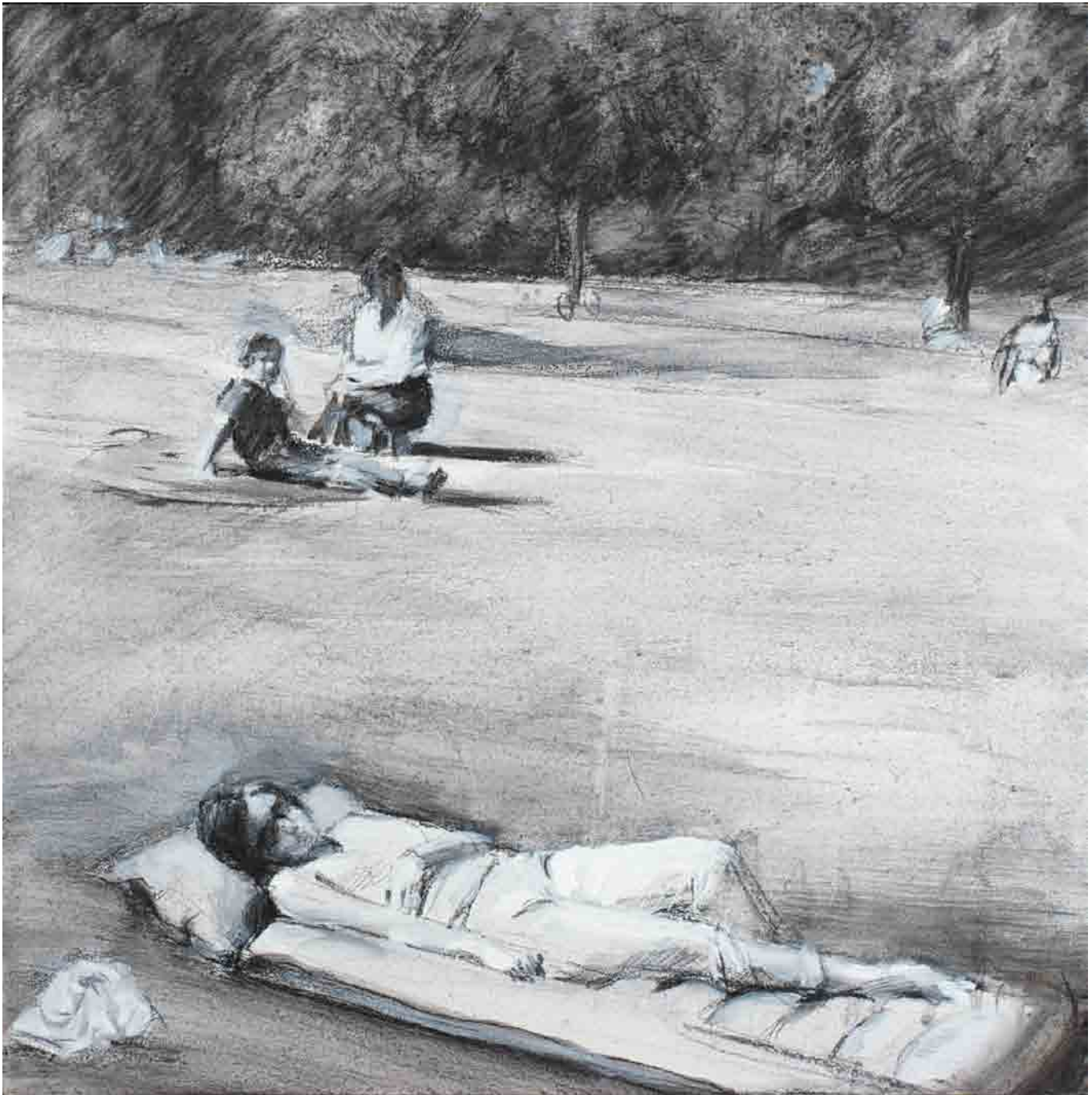
S.T., 2008, Fusain et acrylique sur bois – 35 x 35 cm