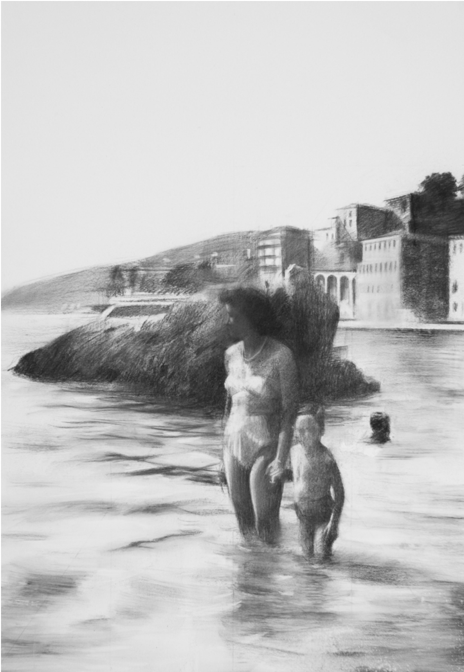
Al sol, 2011 - fusain sur toile – 116 x 81 cm

2005 École Supérieure des Beaux-Arts - Université de Barcelone (UB) - Département Peinture / Dessin.