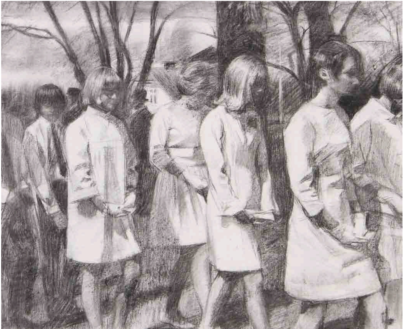
Parade, 2011 - fusain sur toile – 50 x 61 cm

His works are held in the collection of the University of Barcelona (Spain), BIÛtenweiss Archive (Germany), JISER (Spain/Tunisia) and private collections in France, Germany, Portugal, Spain, Sweden, Switzerland, Tunisia and United Kingdom.