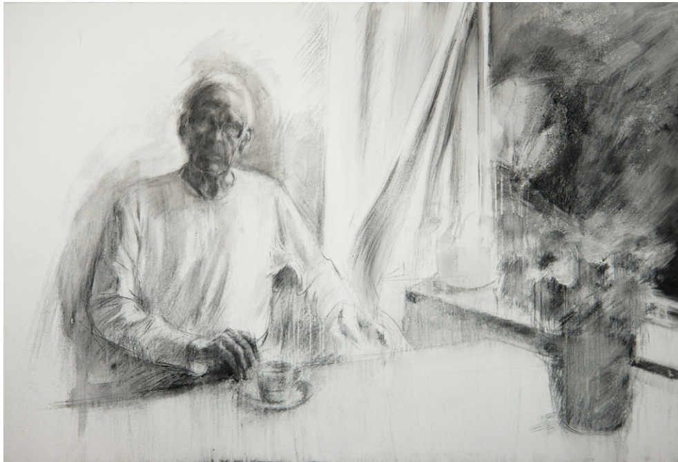
La fenêtre, 2006 – Huile et fusain sur toile - 89 x130

David Carmack Lewis, All the Art out There, 3/12/2009