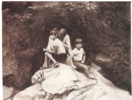
Miquel Wert Reunidos, 2011, fusain et acrylique sur toile, 65 x 81 cm

Galerie Art du Temps - Place de l'Église - 26450 Cléon d'Andran (Drôme Provençal) Tél. +33 (0)4 75 00 46 58 Du 17 novembre 2011 au 22 janvier 2012