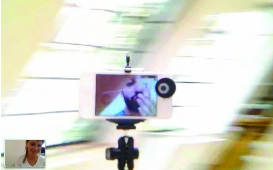
A Truly Magical Moment / Crédits : Adam Basanta

protagonistes vivraient ce moment enivrant via l'application de visioconférence FaceTime.