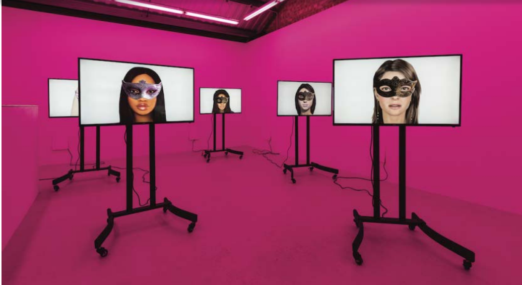
Ashley Madison Angels at Work in Paris / Crédits : !Mediengruppe Bitnik

Cliquez ici pour commencer à gagner des usbeks !