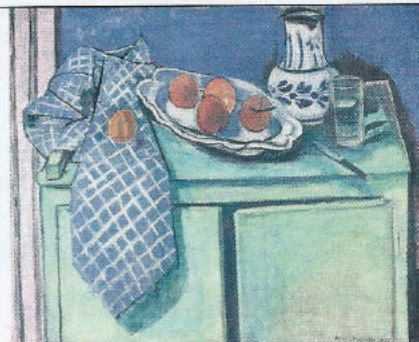
HENRI MATISSE Nature morte au buffet vert , 1928

Le 7 juin, les États-Unis ont restitué près de 200 objets d'art et artefacts indiens pour un montant total estimé à près de 90 M€. Des œuvres pillées et sorties illégalement du pays. Parmi lesquelles une statue de Manikkavachakar, saint poète shivaïte (entre 850 et 1250 ap. J.-C.), volée dans un temple situé à Sripuranthan et estimée à plus de 1,3 M€. Depuis 2007, les États-Unis ont restitué plus de 8 000 objets volés dans 30 pays.