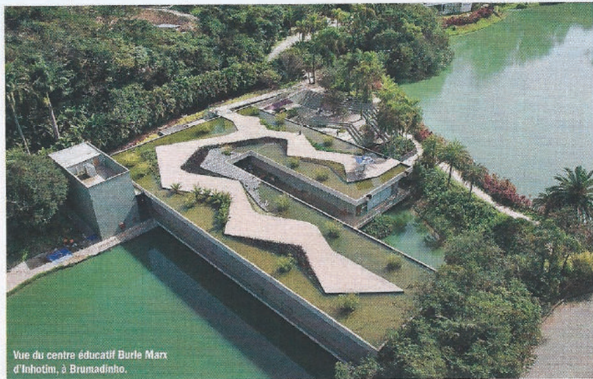
Vue du centre éducatif Burle Marx d'Inhotim, à Brumadinho.

Du 1 er au 11 septembre - www.inhotim.org.br