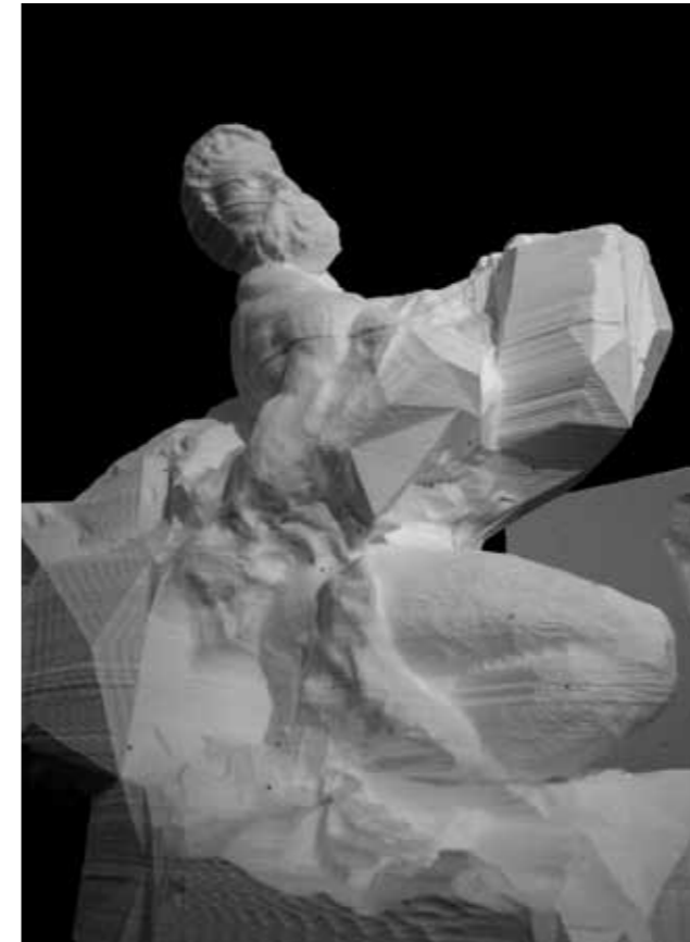
Quayola, Captives (2014). EPS de alta densidad / high-density EPS, 200x140x70 cm cada pieza / each piece. Cortesía / courtesy of bitforms gallery (N. York) & MU (Eindhoven, Holanda / Netherlands).

UNPAINTED has begun its trajectory with a well-articulated approach, despite the deficiencies and lack of confidence characteristic of any emerging event. In future editions it will undoubtedly manage to expand its resources and refine its selection, but it has established a model to follow. In the opinion of gallerists, participation is positive because