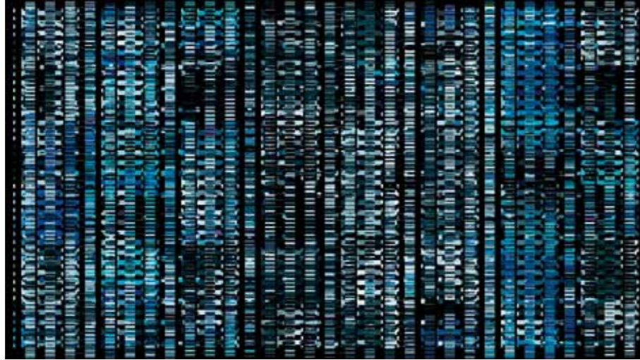
Casey Reas, Signal to Noise No.3 (2013). Software, medidas variables / variable dimensions.