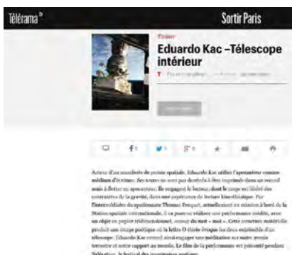
Télérama «Télescope Intérieur» de Thierry Voisin