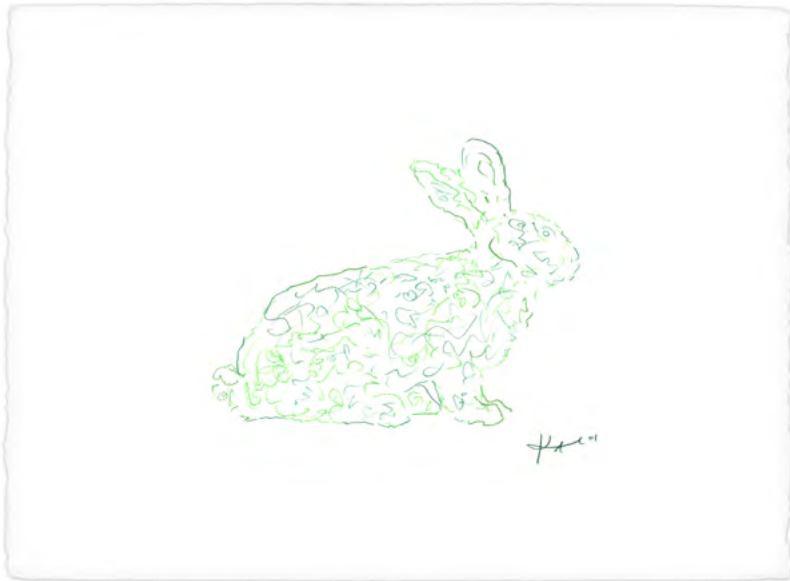
Eduardo Kac, Dorénavant, 2001 Aquarelle sur papier Watercolor pencil on watercolor paper 16 x 20 cm Unique

Eduardo Kac, Tour à tour et parfois en même temps, 2002 Aquarelle sur papier Watercolor pencil on watercolor paper 16 x 20 cm Unique