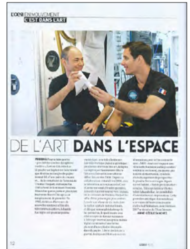
L'OEil - 15/04/2017 «De l'art dans l'espace» de Anne-Cécile Sanchez