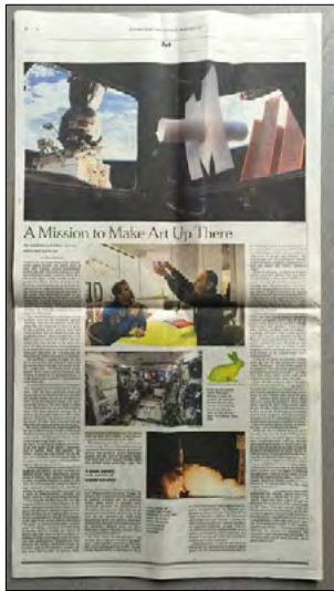
New York Times - 15/04/2017 « A Space Odyssey : Making Art Up There » de Frank Rose