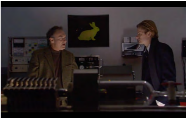
«Teknolust», Lynn Ershman Leeson