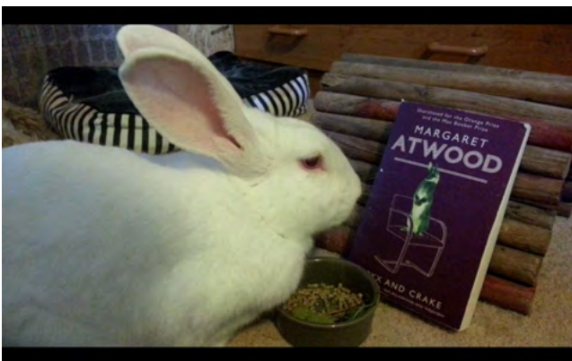
«Oryx and Crake», Margaret Atwood