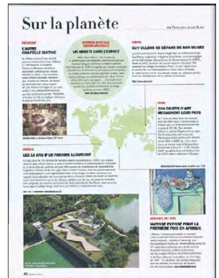
Beaux Arts Magazine 01/09/2016 «Station spatiale internationale : un artiste dans l'espace» de Françoise-Aline Blain