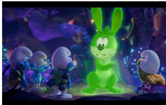
Smurf - Glow Bunnies