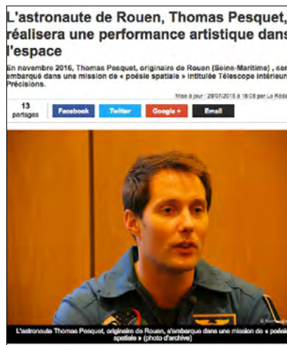
Actu.fr - 29/07/2016 «L'astronaute de Rouen, Thomas Pesquet, réalisera une performance artistique dans l'espace»