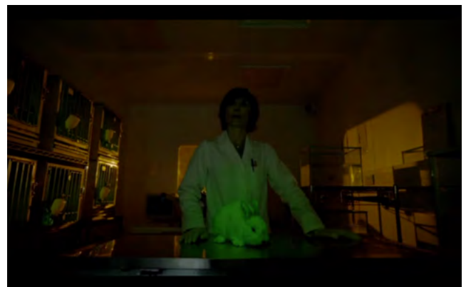
«Sherlock», BBC, episode 2, season 2