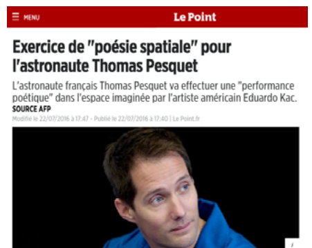
Le Point - 22/07/2016 «Exercice de poésie spatiale pour l'astronaute Thomas Pesquet»