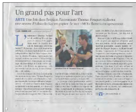
Le Figaro - 18/11/2016 «Un grand pas pour l'art» de Claire Bommelaer