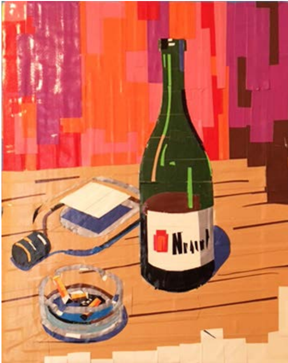
Mikhail Margolis Nature morte aux deux bouteilles, 2016 Peinture au scotch / Color tape painting Carton, scotch / Paperboard, tape 40x32 cm