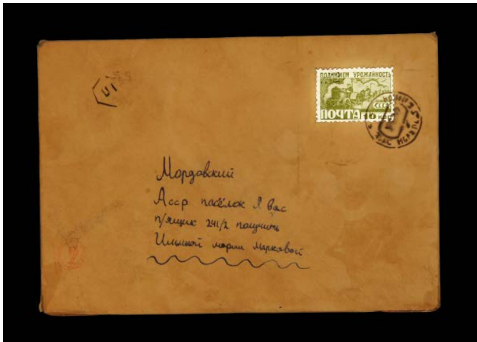
Lettres perdues / Lost letters, objets vidéo / video objects, Enveloppe, écran, batteries / envelop, screen, battery, 50 x 30 cm, 2011

2009 Soutien Scam et Arcadi pour la création de Memo, installation interactive à partir d'anciens timbres postaux.