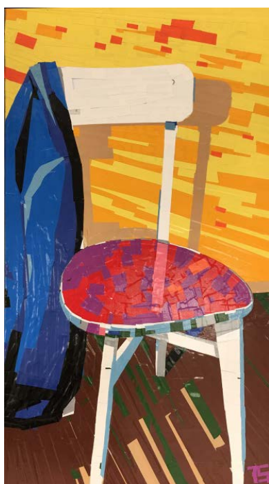
Mikhail Margolis Nature morte à la veste bleue, 2016 Peinture au scotch / Color tape painting Carton, scotch / Paperboard, tape 110 x 60,5 cm