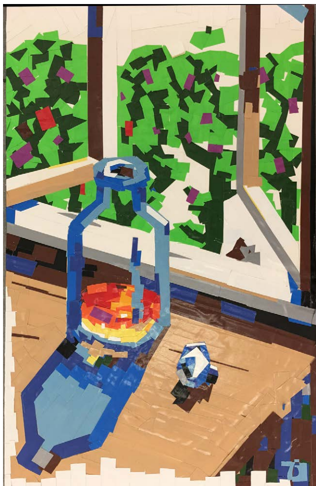
Mikhail Margolis Nature morte à la bouteille de scotch, 2016 Peinture au scotch / Color tape painting Carton, scotch / Paperboard, tape 80x50,5 cm