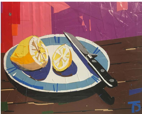
Mikhail Margolis Nature morte au citron, 2016 Peinture au scotch / Color tape painting Carton, scotch / Paperboard, tape 25x32 cm