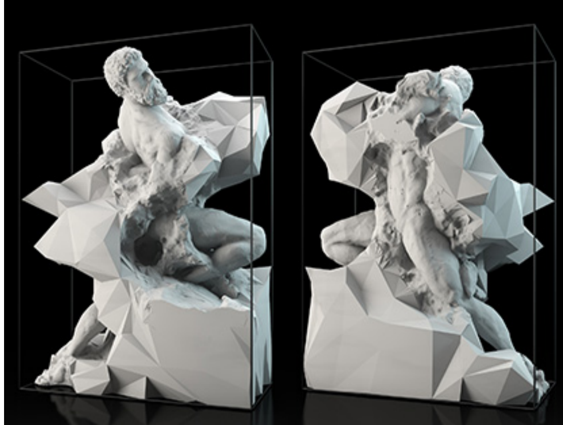
Quayola, Captive (1) , 2013, Courtesy Bitform Gallery.

Le solo show de la Bitform Gallery de New York dirigée par Steven Sacks permet de découvrir la série in progress des œuvres de Quayola rendant hommage au style non-finito de Michel Ange. Les modèles en trois dimensions des "Captives", dans l'image, sont révélés par les fluctuations d'un marbre fluidifié par les algorithmes. Une documentation vidéo donne à voir le travail du robot industriel qui libère les prisonniers de leurs blocs de polystyrène. Et Quayola de citer le