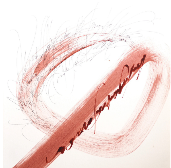
Onde lignée 2014 Encre de chine sur papier 25 x 25 cm