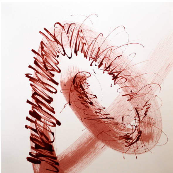
Onde polarisée 2014 Encre de chine sur papier 25 x 25 cm