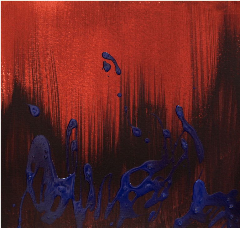
Souffle 2014 Acrylique et encre de chine sur papier 20 x 19 cm