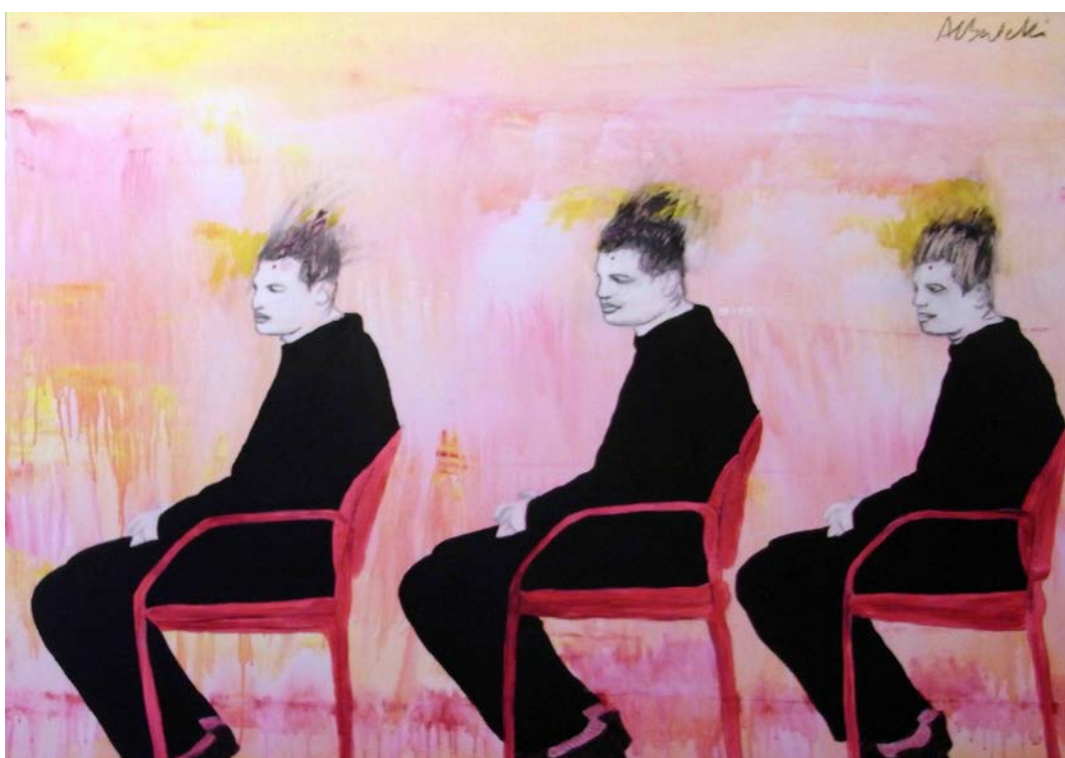
Dominique Albertelli, Ils sont tous là, peinture et fusain, 162 x 130 cm, 2012