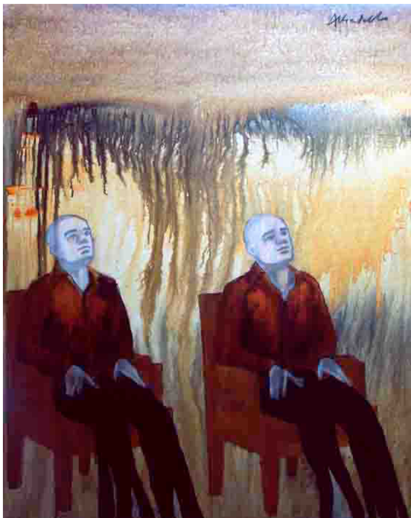
Dominique Albertelli, Les rêveurs, peinture et fusain, 100 x 81 cm, 2011