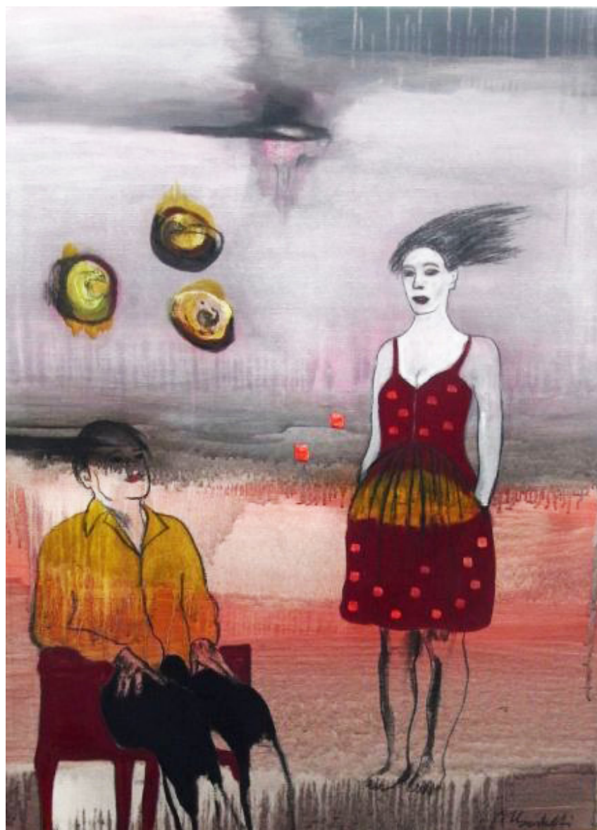
Dominique Albertelli, Au delà des mots, peinture et fusain, 130 x 97 cm, 2011

Exposition du 9 Janvier au 16 Février 2013