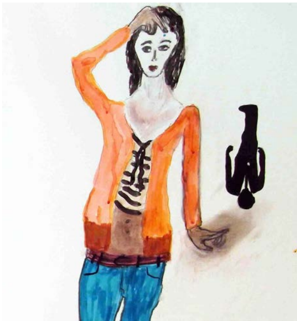
Dominique Albertelli, Sans titre, encre et pastel sec sur papier, 40 x 40 cm, 2012