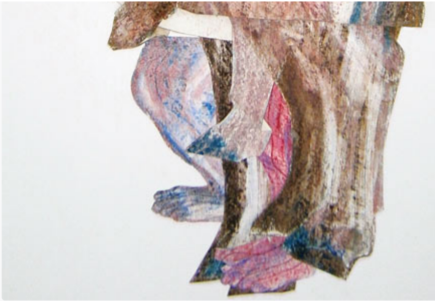
Podane de Patrick Chambon collage-pastel sur papier 50 x 100 cm 2013

Les hommes se font passer pour des animaux ou les animaux se font passer pour des hommes, mais ils sont trahis par leurs pieds, la première et dernière chose qui doit toucher terre et qui ne soit pas remplacée par des pattes. Âne à peau d'homme ou homme à peau d'âne, qui colle à la peau de qui, qui s'enroule dans qui, dans quoi ? La peau est comme un costume sorti, déplié, étendu, revêtu, pour substituer ses plis aux replis de celui qui le porte.