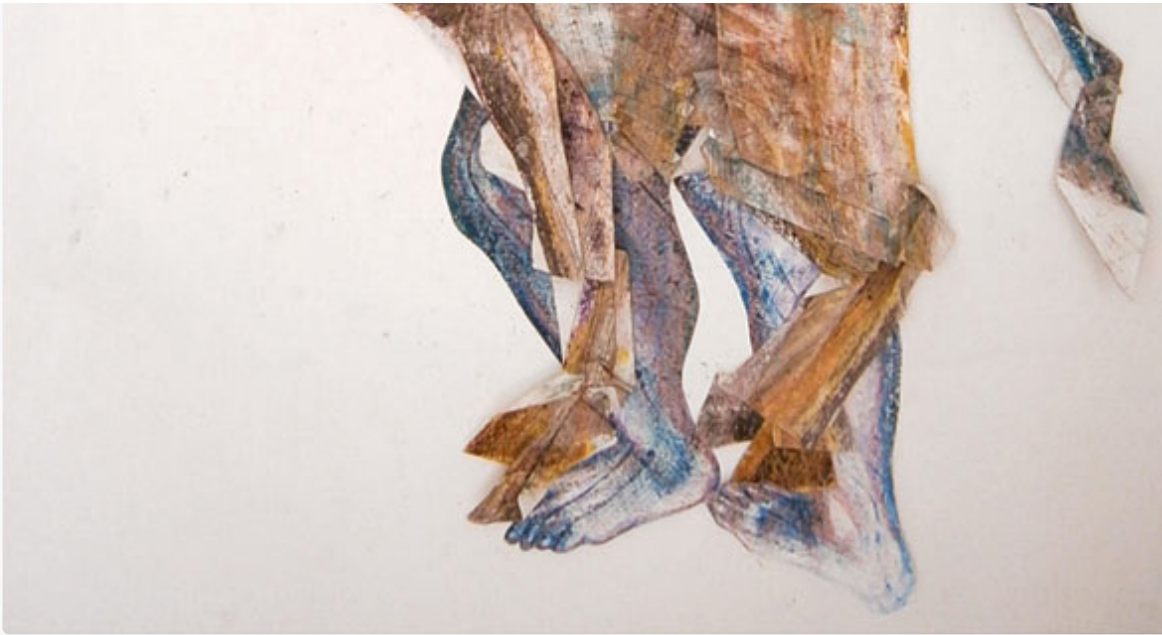
Peudom 1 de Patrick Chambon collage-pastel sur papier 60 x 80 cm 2013

Ou alors, faut-il regarder le déguisement des hommes de Patrick Chambon comme des opérations de tricherie ? On connaît son goût pour la pensée, les mots, la voix de Lacan, alors aurait-il voulu représenter l' autruicherie ? Est-ce une évocation de l'espace de création des enfants jouant avec les draps d'un lit et s'en faisant des univers, celui dont fait l'éloge Foucault en parlant des hétérotopies ? Qu'est-ce que le lieu du déguisement, du travestissement, est-il un espace de liberté ou de contrainte ?