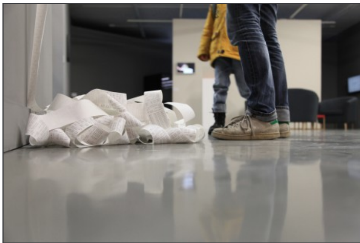
« La Valeur de l'Art », 2010, Christa Sommerer et Laurent Mignonneau, détail 2 (Aurélien Cenno)

Sa valeur finale dépendra directement du temps que les gens auront passé à la regarder – qu'il s'agisse de critiques, de collectionneurs ou des minots qui s'arrêtent deux secondes, intrigués, en sortant de leur cours de sport. Car La Maison Populaire de Montreuil, avant d'être un centre d'art, est surtout une maison de quartier.