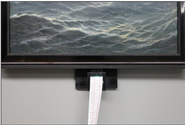
« La Valeur de l'Art », 2010, Christa Sommerer et Laurent Mignonneau, détail 1

Cette installation s'appelle « La Valeur de l'Art » et elle interroge ironiquement d'où vient la valeur dans une économie de l'attention. C'est une des pièces phares de la petite mais riche exposition d'art numérique qu'organise la Maison Populaire de Montreuil.